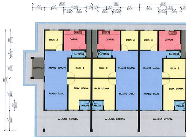
UNIT TERES 1 TINGKAT

“ IKLAN INI TELAH DILULUSKAN OLEH JABATAN PERUMAHAN NEGARA. MAKLUMAT PEMAJUAN DAN IKLAN YANG DILULUSKAN BOLEH DISEMAK DI PORTAL TEDUH.KPKT.GOV.MY”