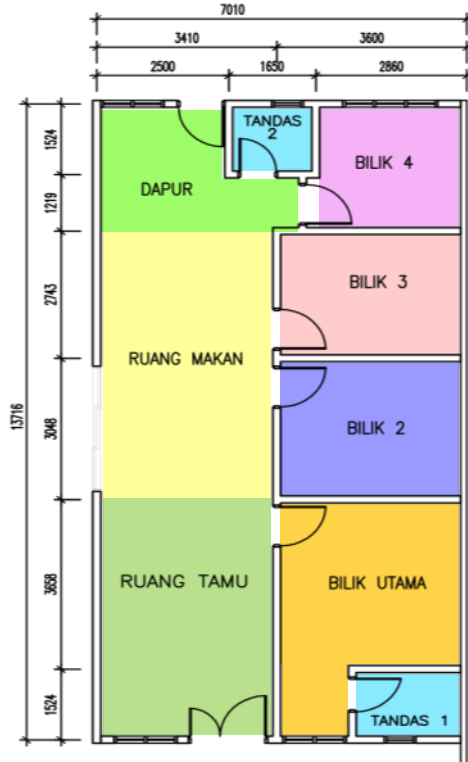
RUMAH TERES SETINGKAT Keluasan Lantai: 1,035 kaki persegi / 23' x 45'