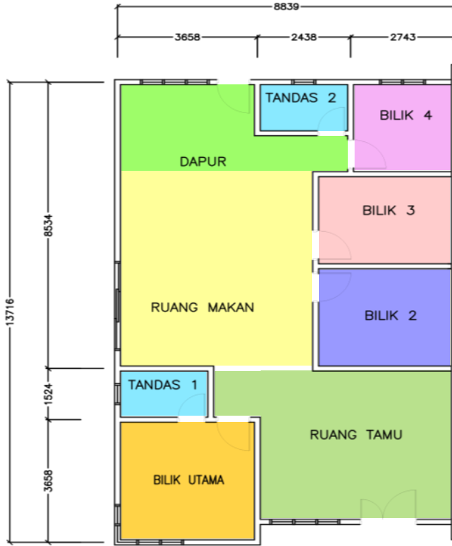
RUMAH BERKEMBAR SETINGKAT Keluasan Lantai: 1,305 kaki persegi / 29' x 45'