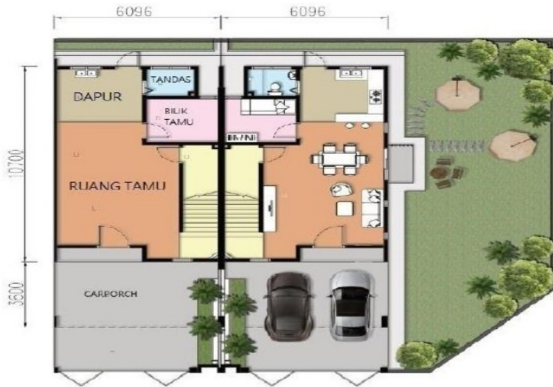
PELAN LANTAI TINGKAT BAWAH