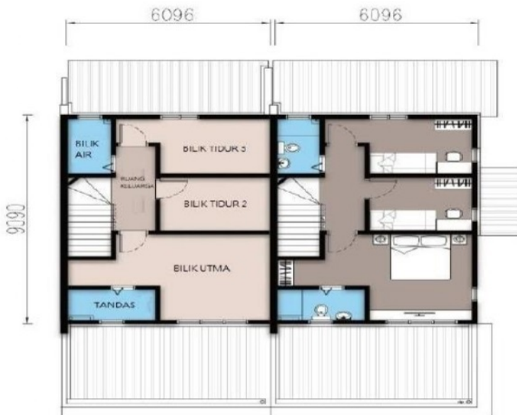
PELAN LANTAI TINGKAT ATAS

NO.LESEN : 19559/12-2028/0541(A) NO.PERMIT&JUALAN : 19559-2/04-2026/0327(A)-(L) BEBANAN TANAH : TIADA TEMPOH SAH LAKU : 19/04/2024-18/04/2026 NO.RUJUKAN MAJLIS : MBAS/B/35/22.JLD.4(5) BILANGAN UNIT : 67 UNIT JENIS PEGANGGAN/HAKMILIK : PAJAKAN 99 TAHUN STATUS TANAH : REZAB MELAYU TEMPOH SAH LAKU : 22/12/2025-21/12/2028 TEMPOH SAH LAKU : 7 APRIL 2121