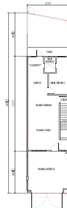
PELAN LANTAI TINGKAT BAWAH