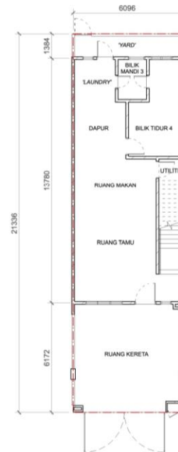
PELAN LANTAI TINGKAT BAWAH