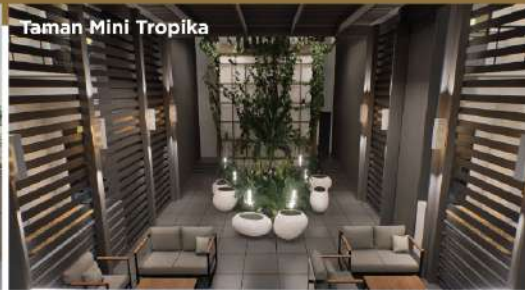
Taman Mini Tropika