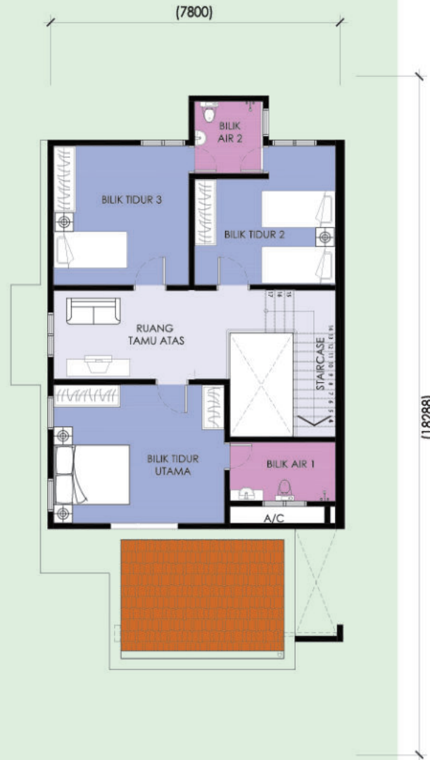
Pelan Tingkat Pertama

Unit Penjuru 299.10m 2 4 Bilik 3 Bilik Air 20' X 60'