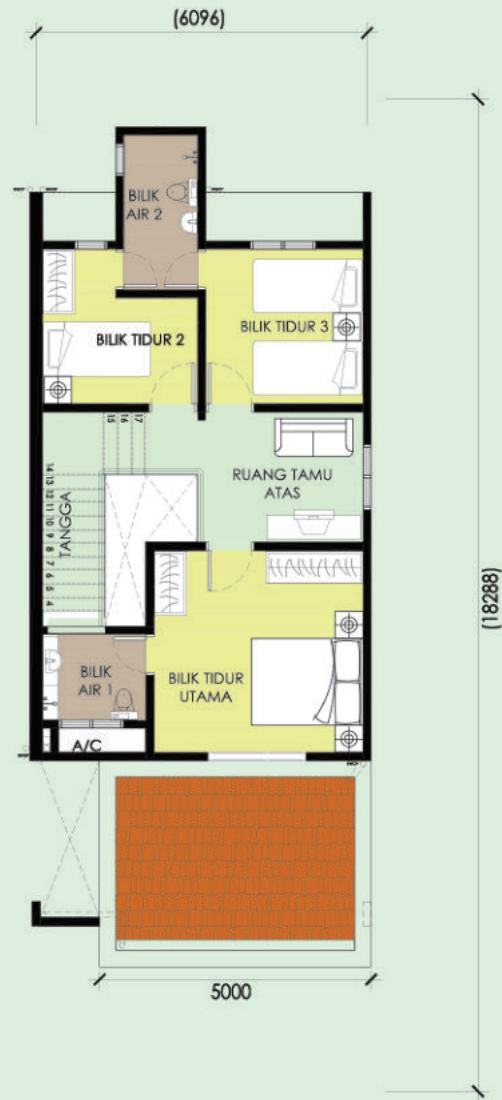
Pelan Tingkat Pertama