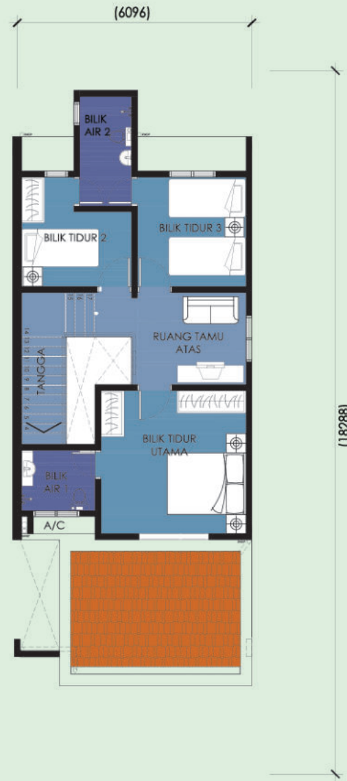
Pelan Tingkat Pertama

Unit Hujung 111.50m 2 4 Bilik 3 Bilik Air 20' X 60'