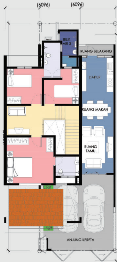
Pelan Tingkat Bawah

Unit Hujung 111.50m 2 4 Bilik 3 Bilik Air 20' X 60'