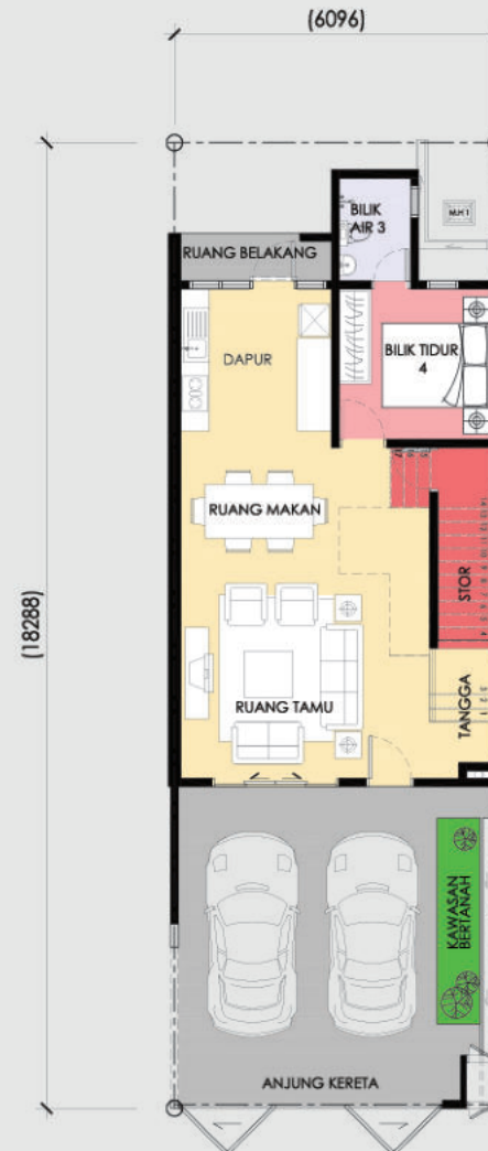
Pelan Tingkat Bawah