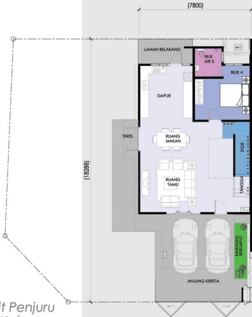
Pelan Tingkat Bawah