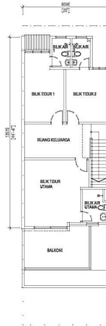
PELAN TINGKAT SATU