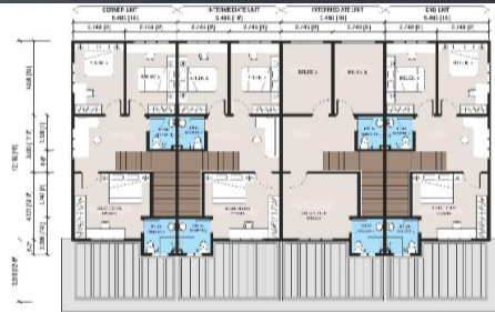
PELAN LANTAI TINGKAT BAHU

LOT 5777 - 5792 & LOT 5802 - 5833 TAMAN BATU GAJAH BAKTI, MUKIM SEBATU, DAERAH JASIN, MELAKA