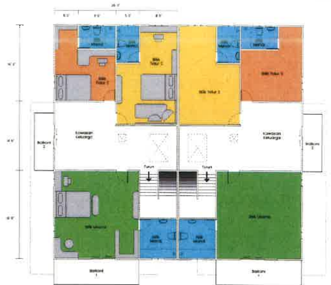
PELAN TINGKAT PERTAMA

IKLAN INI TELAH DILULUSKAN OLEH JABATAN PERUMAHAN NEGARA