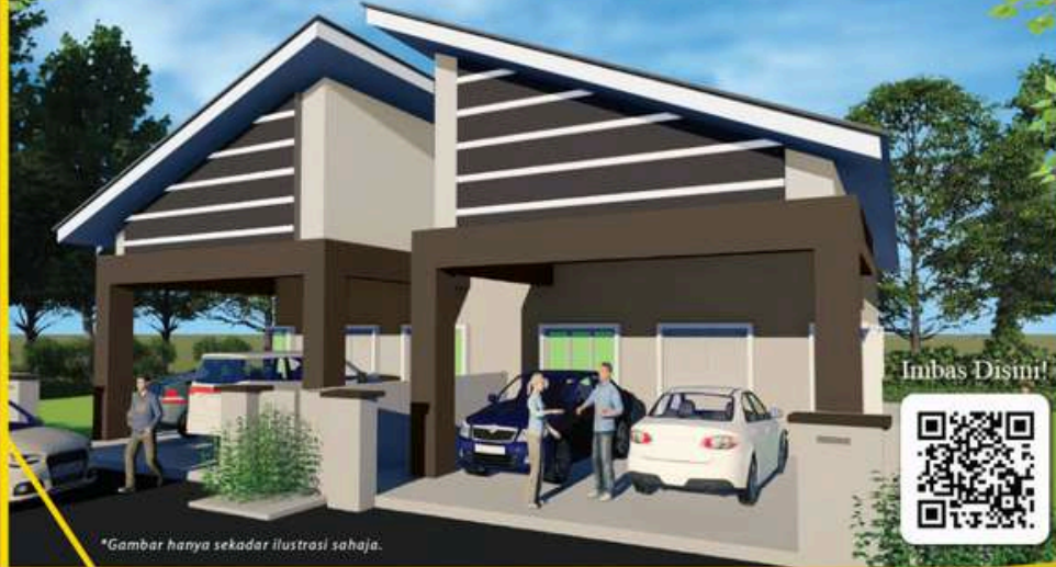
*Gambar hanya sekadar ilustrasi sahaja.