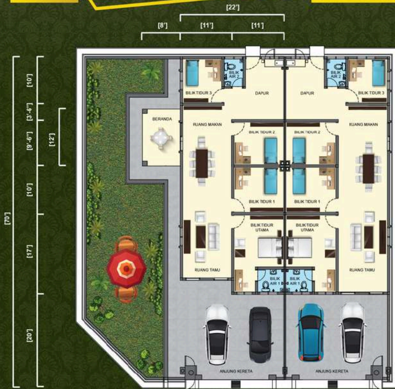
*Ilustrasi diatas menunjukkan Pelan Lantai Rumah Teres Setingkat 22'x70'.