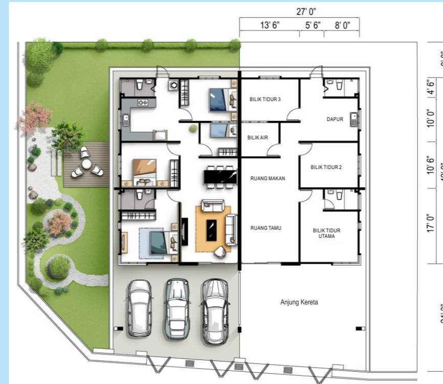
RUMAH BERKEMBAR SETINGKAT JENIS A (10 UNIT) LUAS TANAH (MIN) : 35' X 76' LUAS BINAAN : 27' X 42'