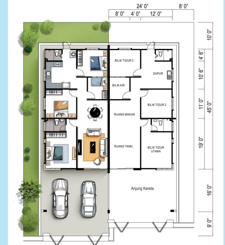
RUMAH BERKEMBAR SETINGKAT JENIS B (10 UNIT) LUAS TANAH (MIN) : 32' X 75' LUAS BINAAN : 24' X 45'