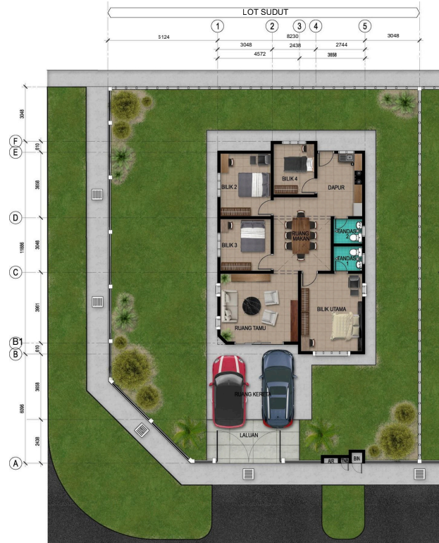
Rumah Sesebuah 1 Tingkat 57' X 69' (1 Unit)