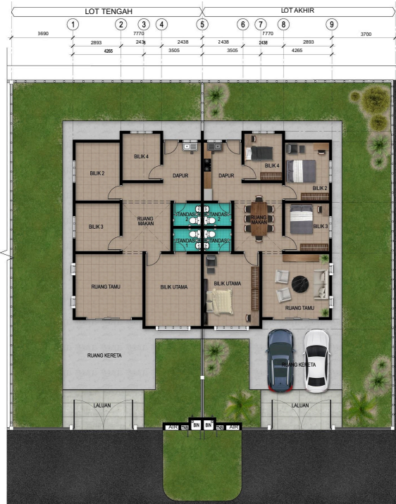
Rumah Berkembar 1 Tingkat 38' X 69' (26 Unit)