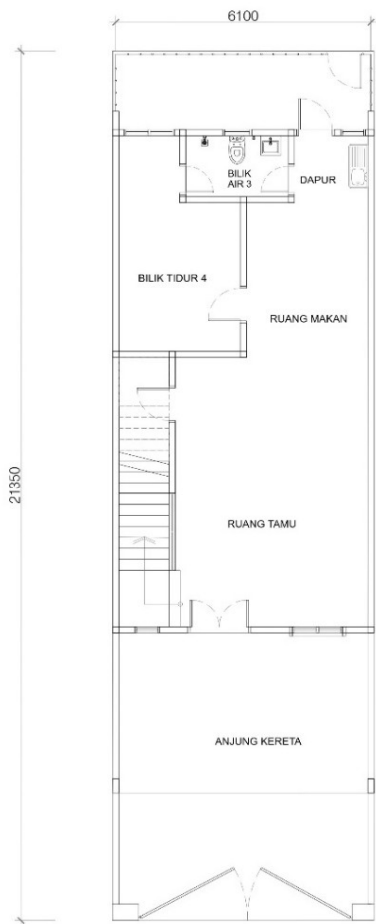
PELAN LANTAI TINGKAT BAWAH