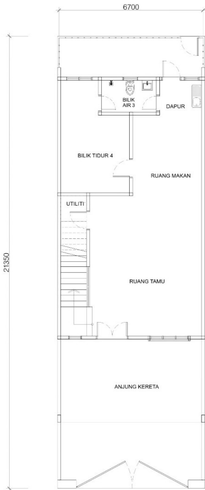
PELAN LANTAI TINGKAT BAWAH