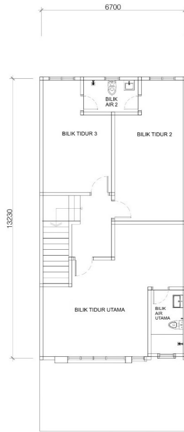
PELAN LANTAI TINGKAT ATAS