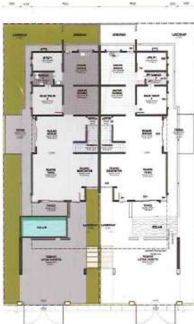
PELAN LANTAI BAWAH

Double Storey Semi-D Type A Land Area (Sq Ft) : 3,411 (Min) – 4,358 (Max) Built-Up Area (Sq Ft) : 2,800