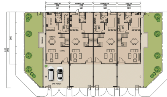
PELAN TINGKAT BAWAH