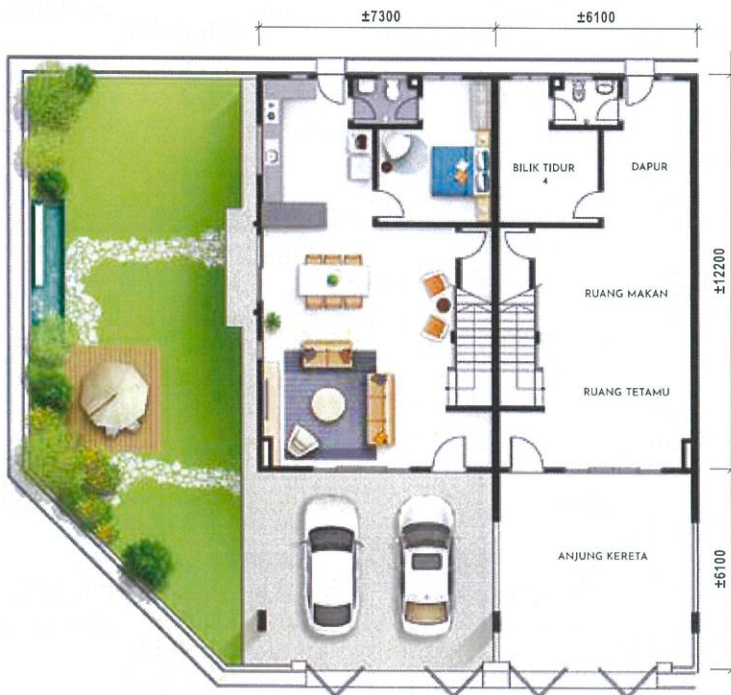
Pelan Lantai Bawah Teres Dua Tingkat - Jenis A2