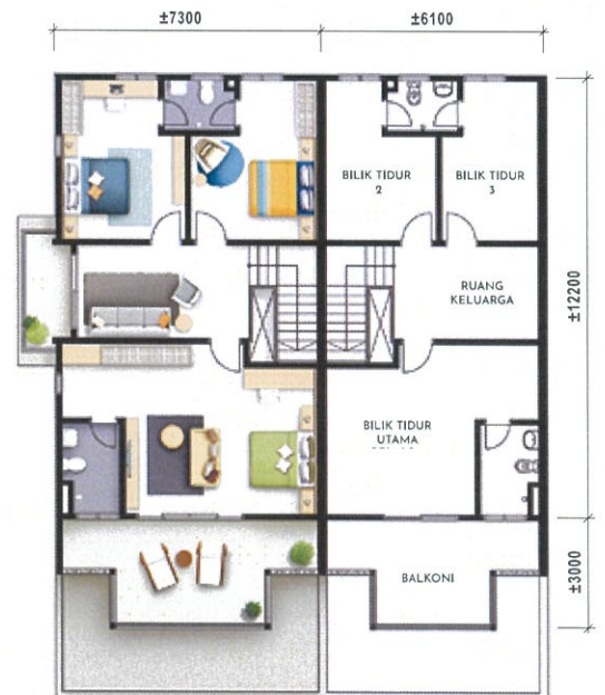
Pelan Lantai Atas Teres Dua Tingkat - Jenis A2