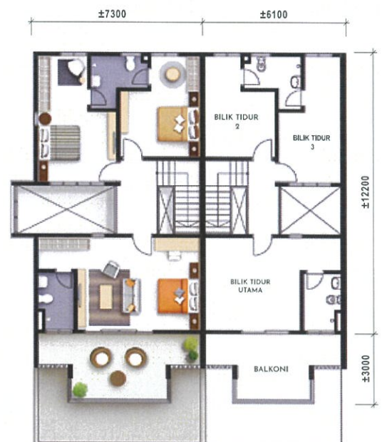
Pelan Lantai Atas Teres Dua Tingkat - Jenis A1