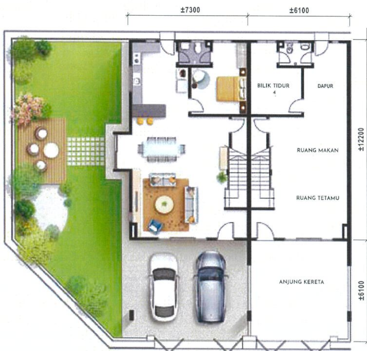
Pelan Lantai Bawah Teres Dua Tingkat - Jenis A1