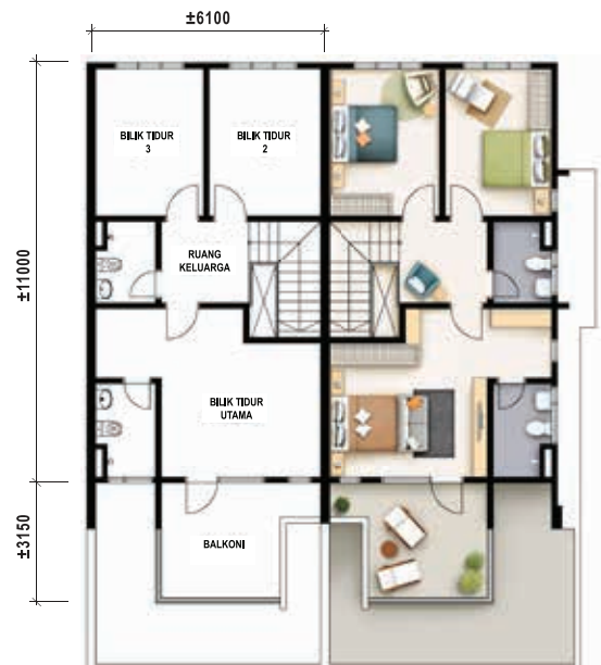
Pelan Lantai Atas Teres Dua Tingkat - Jenis B