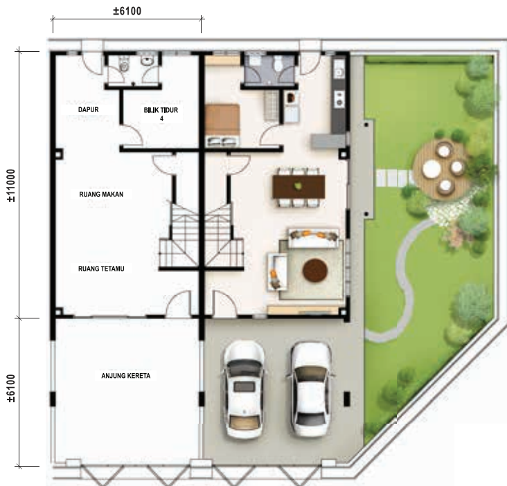
Pelan Lantai Bawah Teres Dua Tingkat - Jenis B