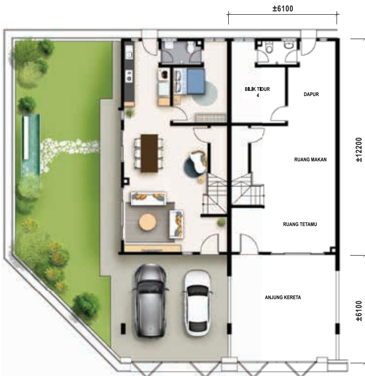
Pelan Lantai Bawah Teres Dua Tingkat - Jenis A