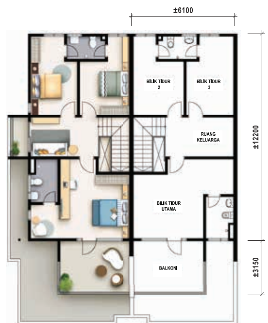
Pelan Lantai Atas Teres Dua Tingkat - Jenis A