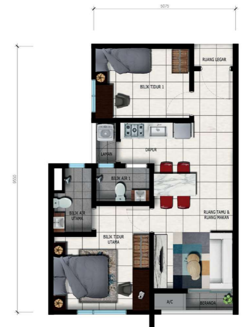
2 BILIK, 1 BILIK MANDI, 1 TANDAS | 595 sq.ft JENIS C