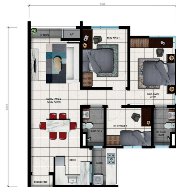
3 BILIK, 2 BILIK MANDI | 871 sq.ft JENIS A