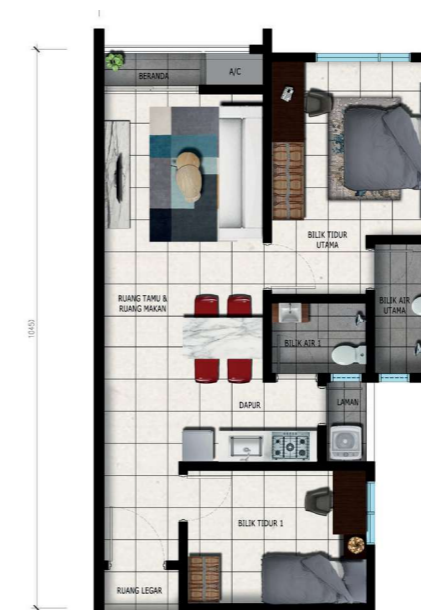
2 BILIK, 2 BILIK MANDI | 654 sq.ft JENIS B