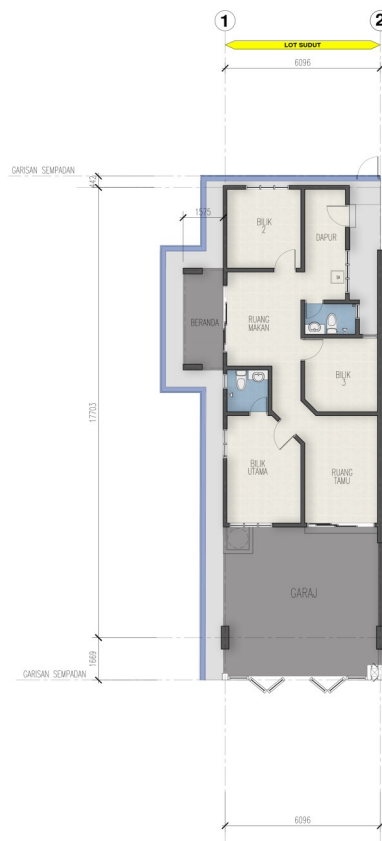
PELAN LANTAI - LOT SUDUT