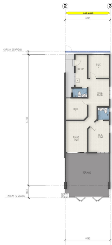
PELAN LANTAI - LOT AKHIR