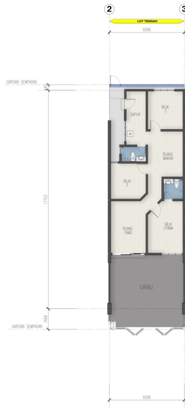
PELAN LANTAI - LOT TENGAH