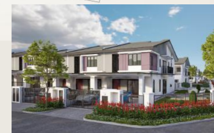
JENIS B RUMAH TERES 2 TINGKAT 22' X 75'