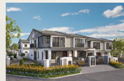
JENIS A RUMAH TERES 2 TINGKAT 22' X 70'