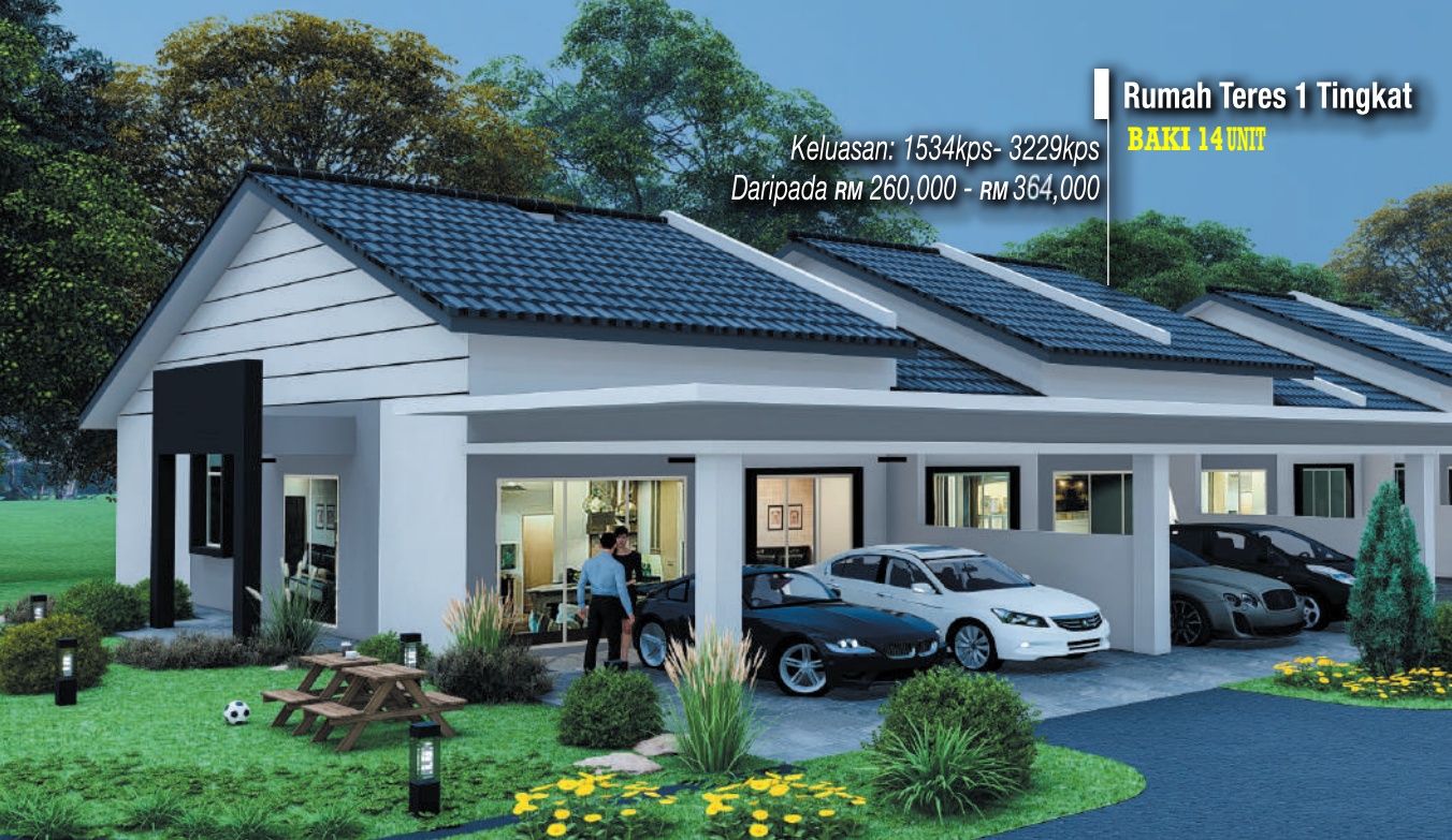
Rumah Teres 1 Tingkat BAKI 14 UNIT Keluasan: 1534kps- 3229kps Daripada RM 260,000 - RM 364,000