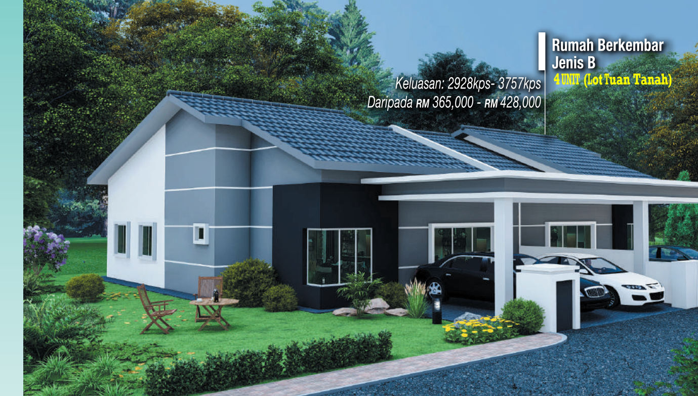
Rumah Berkembar Jenis B 4 UNIT (Lot Tuan Tanah) Keluasan: 2928kps- 3757kps Daripada RM 365,000 - RM 428,000