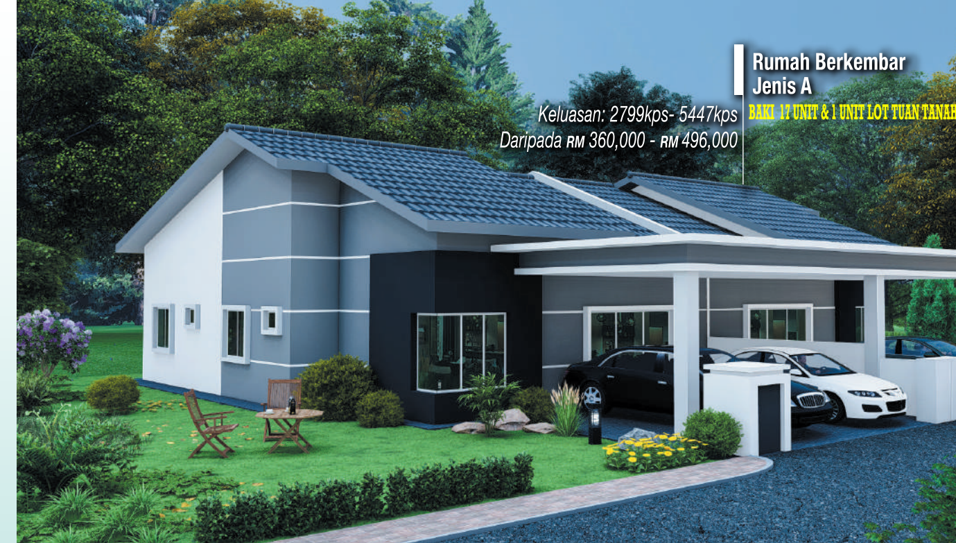
Rumah Berkembar Jenis A BAKI 17 UNIT & 1 UNIT LOT TUAN TANAH Keluasan: 2799kps- 5447kps Daripada RM 360,000 - RM 496,000